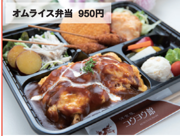
オムライス弁当 950円