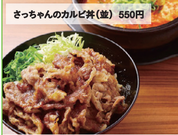
さっちゃんのカルビ丼(並) 550円

かんどん カルビ丼とスン豆腐専門店 韓井 豊橋地下店 ☎0532-26-7776